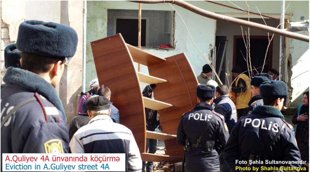
A.Quliyev 4A ünvanında köçürmə Eviction in A.Guliyev street 4A

Besides R. Huseynov 72 more families used to live in the 9 store building at the Flag Square, A. Guliyev street 5. According to the Order of Baku CEA, number 71, dated February 15, 2011, that building was to be demolished and inhabitants evicted. As a reason of that demolition the Order states the necessity of expansion of the territory of State Flag Square, renovation of surrounding areas and also refers to the government's needs and Chief Plan of Baku city. On February, 2012, 21 inhabitants who were obliged to leave the demolished