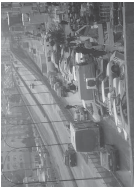
3-cü mikrorayon dairəsi: yol qovşağı ara-sıra istifadə olunur.