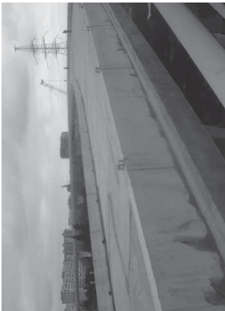
Yollar kimi uzanan körpülər. «Əzizbəyov» dairəsindəki yol qovşağı bu qəbildən olan ən bahalı layihədir.