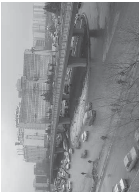
Yeni körpü köhnə problemləri həll edə bilmədi: «20 Yanvar» dairəsində tıxacdır ki, tıxacdır.