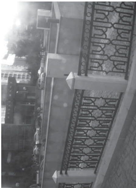
Milli Bankın yanındakı yeraltı keçid istifadədədir, amma bura hələ də "pul xərclənir".